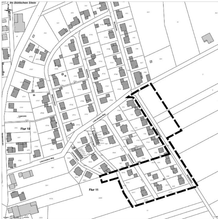
Geltungsbereich des Bebauungsplanes Landau Nr. 6 „Linsenköppel“