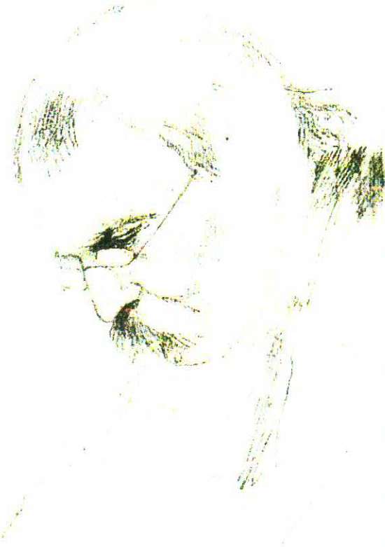
Wilhelm von Kaulbach (1804-1874)